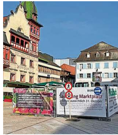
Anfang letzter Woche wurden die Arbeiten für den ersten Abschnitt der Marktplatzsanierung in Dornbirn begonnen.

GASTHOF MEINDL +43 5577 82586 www.gasthof-meindl.at Hofsteigstr. 15, Lustenau